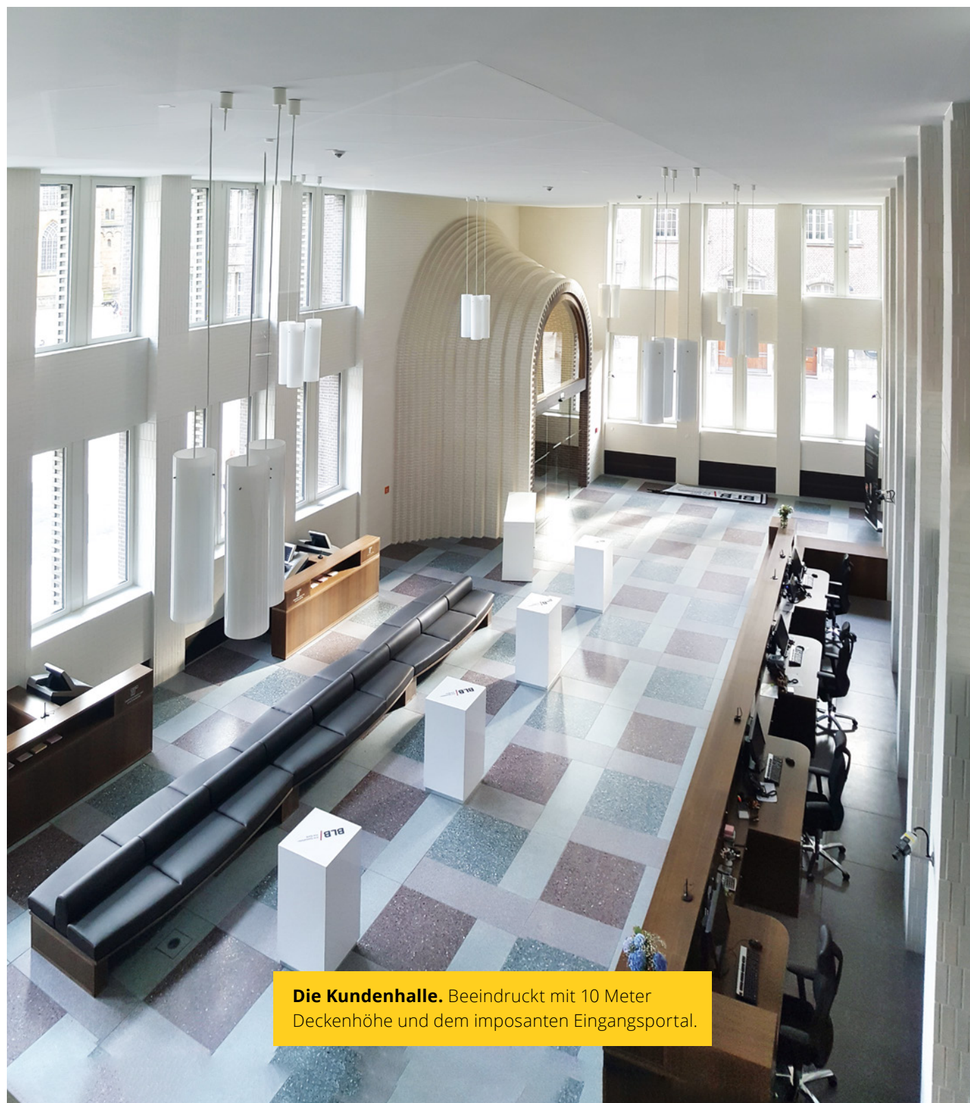
Die Kundenhalle. Beeindruckt mit 10 Meter Deckenhöhe und dem imposanten Eingangsportal.

Gerundete Wandoberflächen mit ästhetischer Farbgebung verleihen den Büros in den sechs Etagen in Kombination mit Teppich und Alu-Rasterdecke englischen Charme. Die von TM Ausbau realisierten Holz-Glas-Trennwände lassen flexible Änderungen im Nutzungskonzept zu.