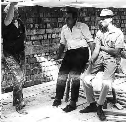
Männer der ersten Stunde · Men of the first hour