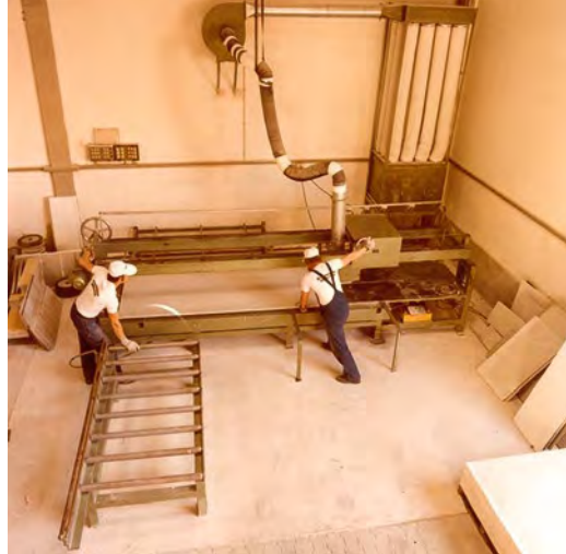
1980er-Jahre in Puchheim · 1980s in Puchheim