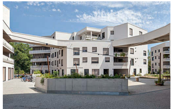
Brücken in luftiger Höhe - Dachterrassen als Bindeglieder • Roof terraces as connecting links

Entwurf • Design ARGE bogevischs buero, München / SHAG Schindler Hable Architekten, München