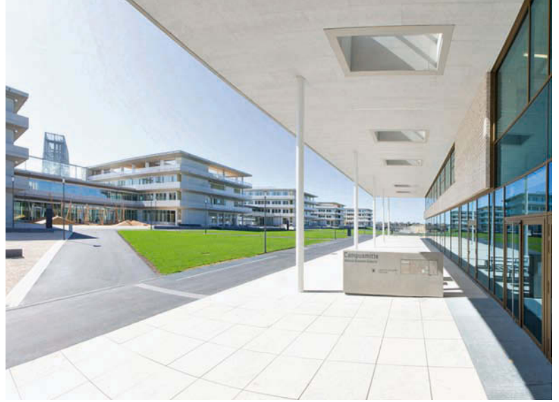
Zwischen den Gebäuden spannen sich Pausenhöfe auf. • Schoolyards are created between the building volumes.

Entwurf • Design schürmann dettinger architekten und Auer Weber, München